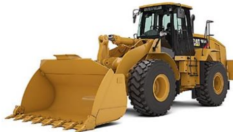
Figura 1. Cargadora frontal 966H (Cat, 2017)

La Serie H cuenta con muchos componentes que influyen en los diseños de productos que han producido máquinas fiables y duraderas durante generaciones. El modelo 966H está diseñado para complementar su plan comercial, reducir las emisiones y minimizar el consumo de recursos naturales. (Yépez, 2012)