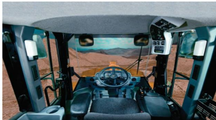
Figura 10. Cabina del conductor de la cargadora Cat 966H.

Vibraciones: Caterpillar entiende que los cargadores de ruedas trabajan en algunos de los entornos más ríginosos. Al controlar las vibraciones normales de la máquina, se mejoran la eficiencia y la productividad del operador. El 966H Cat está diseñado de arriba a abajo con muchas características, tanto normales como optativas, que reducen las vibraciones.