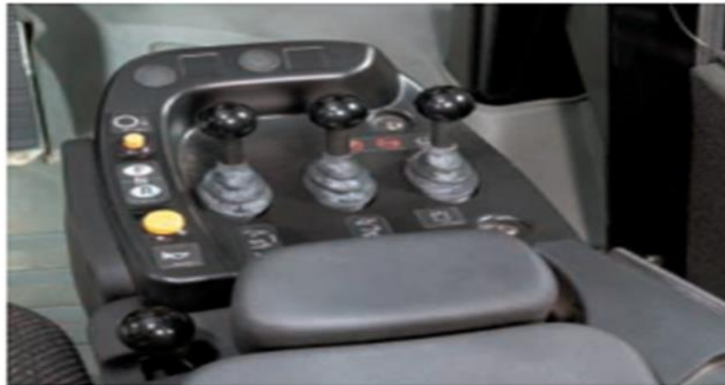
Figura 6. Sistemas de mandos hidráulicos de la cargadora Cat 966H (CatR, 2016)

Los operadores observarán una mayor facilidad de operación, mayor tracción en las ruedas dentro de la pila y un aumento del 20% en la fuerza de levantamiento.