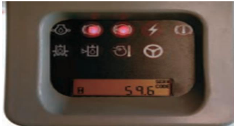
Figura 13. Sistema de monitoreo de la cargadora Cat 966H

La supervisión del estado del producto simplifica la planificación de mantenimiento y reduce los costos, por lo que el Sistema Monitor Caterpillar (CMS) hace el seguimiento de los sistemas críticos de la máquina para alertar al operador de la necesidad potencial de servicio. Tres niveles de advertencia permiten al operador evaluar la situación con mayor precisión.