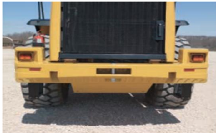
Figura 4. Sistema de enganche de la cargadora frontal Cat 966H (Cat, 2017)

El contrapeso de una pieza está integrado en el diseño y el estilo del 966H. Este contrapeso de 1.142 kg (2.517 lb) incorpora las luces traseras en la parte superior de la estructura.