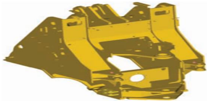
Figura 3. Sistema de enganche de la cargadora frontal Cat 966H (Cat, 2017)

Cuenta con un sistema de enganche extendido el cual la distancia entre las placas de enganche superior e inferior contribuye de forma importante al rendimiento de la máquina y a la duración de los componentes. El diseño de enganche extendido de Caterpillar proporciona una distribución de carga y una duración de los cojinetes excelentes. Tanto los pasadores de enganche superiores como inferiores pivotan sobre cojinetes de rodillos cónicos dobles – aumentando la durabilidad al distribuir las cargas verticales y horizontales sobre una superficie mayor. La abertura ancha también permite un acceso de servicio excelente. (Tracsa, 2017)