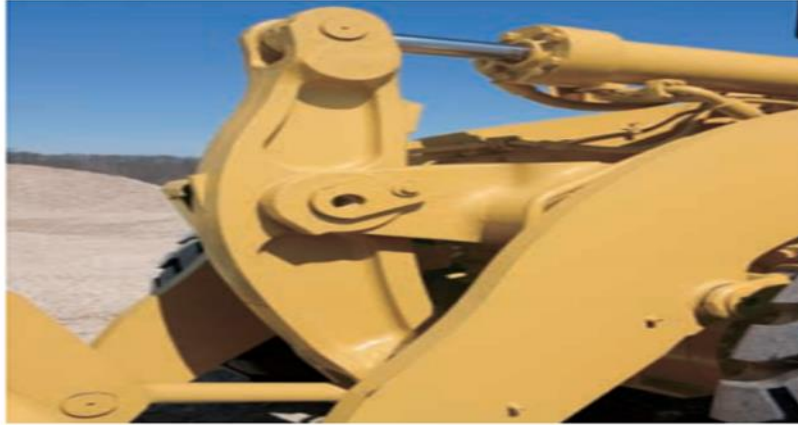
Figura 5. Inclinación de varillaje en Z del cucharón de carga de la cargadora. (Cat, 2017)

se adapta de forma excepcional a los camiones de obras y a los de transporte por carretera. Dispone de sensores giratorios para la palanca de inclinación y el circuito de levantamiento que permiten al operador fijar electrónicamente las posiciones de tope desde la cabina. Tiene un protector que cubre el sensor para protegerlo contra los daños. (Nicholas, 2010)