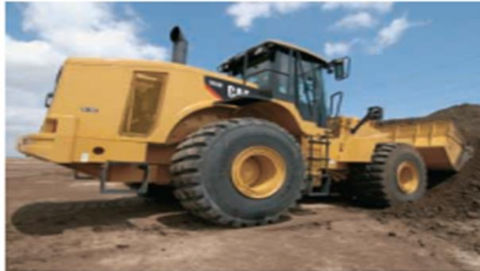
Figura 7. Ventilación lateral de la cargadora Cat 966H. (CatR, 2016)

Muchos cargadores de la competencia usan sistemas de enfriamiento que extraen aire de los lados, a través del compartimiento del motor y lo expulsa por la parte trasera de la máquina. El sistema de enfriamiento del 966H está aislado del compartimiento del motor por medio de un protector no metálico. El ventilador de velocidad variable accionado hidráulicamente extrae aire limpio de la parte trasera de la máquina y lo expulsa por los lados y la parte superior del capó. Los resultados finales son una eficiencia de enfriamiento óptima, mayor eficiencia de combustible, menos obstrucciones del radiador y niveles de sonido reducidos para el operador.