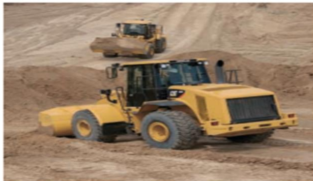
Figura 8. Sistema de transmisión planetaria de la cargadora Cat 966H

Control de cambios variable. Adapta las configuraciones de cambios de la transmisión a los requisitos de las aplicaciones de la máquina. El Control de Cambios Variable (VSC) mejora la calidad de los cambios y la eficiencia del combustible en ciertas aplicaciones dejando que la transmisión efectúe un cambio ascendente a menores rpm del motor.