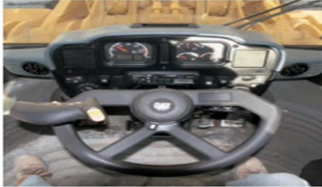
Figura 11. Cabina del conductor de la cargadora Cat 966H.

Cuando no se utilice el sistema de dirección, se dispone de más potencia del motor para generar fuerza de arrastre en las ruedas, fuerza de desprendimiento y fuerza de levantamiento, y resulta en un menor consumo de combustible. La columna de la dirección se inclina para máxima comodidad del operador.