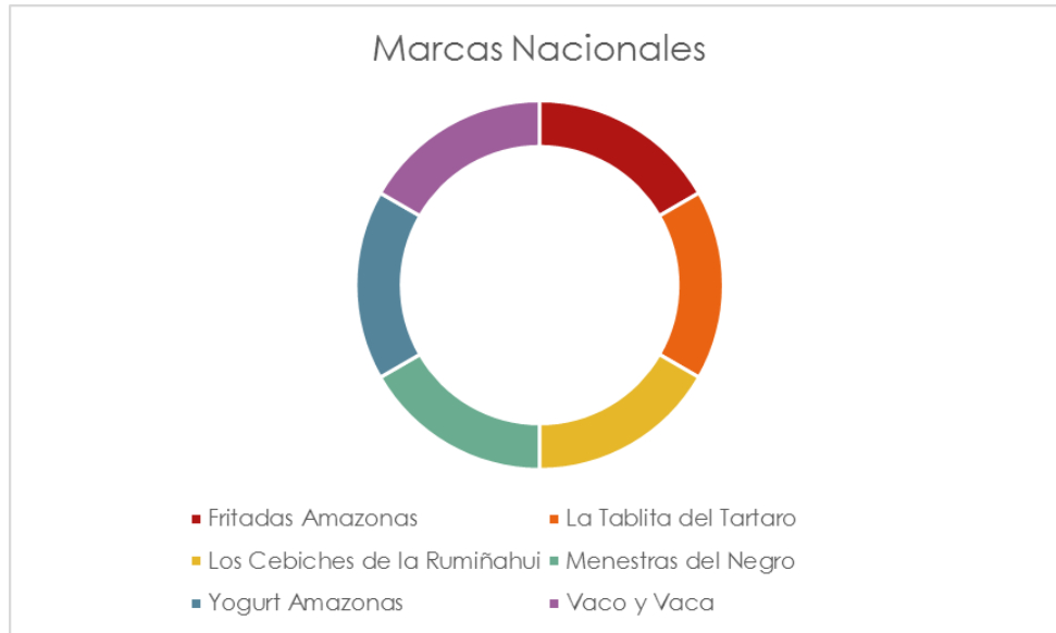
Gráfico 2: Marcas Nacionales que existen en el Centro Comercial Quicentro Elaborado por: Alex Jaramillo 2018