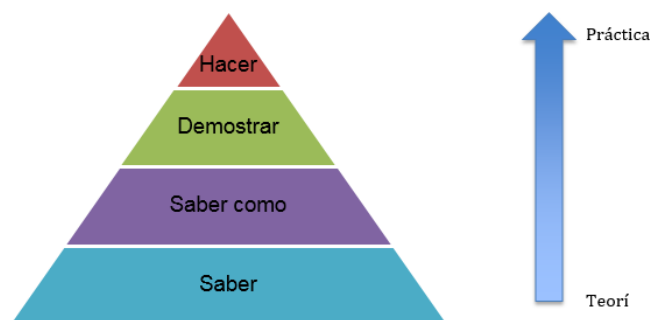
Figura I. Adaptado de Miller (Como se citó en Pantoja, 2012)

En relación con Lichtenberger, (Manriquez Pantoja, 2012) demuestra en la figura 1, cuatro fases sobre el proceso para establecer que una competencia está normalmente desarrollada. Los primeros procesos, son base en una competencia, muestra una clara interacción con lo cognitivo y los siguientes procesos con la conducta.