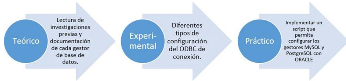
Figura 1. Proceso aplicado de metodología de investigación tecnológica.

Hipótesis: Los gestores ORACLE, MySQL y PostgreSQL pueden funcionar de manera conjunta en una base de datos distribuida en un ambiente CentOS mediante un script de configuración.