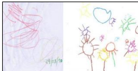
Figura 1. Fase Pre escritora

Otra característica de esta etapa es el ambidextrismo, que es el uso simultáneo de ambas manos y por ende de los dos hemisferios cerebrales. El grafismo de los niños y las niñas que se encuentran en esta etapa no tiene control de frenado, ya que el grafismo aquí es impulsivo. Ya pasados los tres primeros años el niño ya inicia la representación intuitiva, es decir va cediendo la impulsividad motriz, mejora el soporte del lapicero y le da una significación a lo que dibuja. Es ya a partir del cuarto año que el niño inicia el proceso grafomotor, el mismo que le permite reproducir formas geométricas sencillas. Aquí la lateralidad ya se está definiendo por lo que el cambio de mano es infrecuente. Inicia así, el dominio del espacio gráfico.