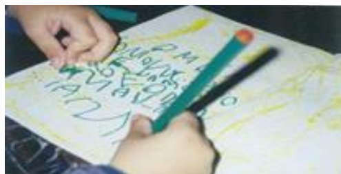
Figura 2. Fase pre caligráfica

Los niños y niñas que al no lograr superar esta etapa pre caligráfica, al llegar a los no alcanzar a los 9 años no afianzarán la escritura y desarrollaran disgrafía con características propias, tales como: simetría inadecuada, presencia elevada de ángulos, dimensión exagerada de la letra, inclinación a la izquierda o recta, unión y soldadura de palabras, inadecuado espacio entrelíneo.