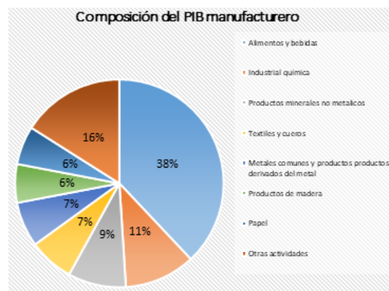
Figura 2. Composición del PIB manufacturero del Ecuador

Dentro de este sector la manufactura aporta sustancialmente a la economía, un ejemplo es la empresa La Fabril, que desarrolla productos de 40 marcas, de las cuales 10 son de exportación y cuentan con líneas de producción apropiadas llegando a transnacionales como Avon y Clorox. La Figura 2 muestra que la elaboración de alimentos y bebidas constituye el 38% dentro del total del producto manufacturero y un producto generado de USD 5.297 millones. En segundo lugar está la industria química con el 11%, le sigue los productos minerales no metálicos (9%), la industria textil y de cuero (7%) y finalmente la metálica (7%).