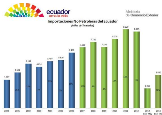
Figura 1. Importaciones no petroleras del Ecuador.

La invención de nuevos productos es una actividad necesaria y fundamental para satisfacer las necesidades de potenciales consumidores y para ser competitivo en un mercado invadido de competencia y productos de importación, ya que por ejemplo se tiene que el nivel de importaciones en Ecuador tiene una tendencia histórica a crecer, pero en los últimos años ha decrecido debido a políticas que impulsan el cambio de la matriz productiva y la producción dentro del País como se observa en la Figura 1.