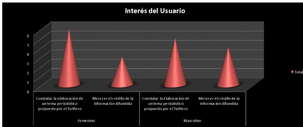
Gráfico 3. Interés del usuario Elaborado por las autoras

En el gráfico 3 muestra el interés del usuario por enviar información a los noticieros matinales centrados en información sobre la ciudad de Guayaquil. De 9 mujeres encuestadas: 6 enviaron su información con el interés de poder constatar la elaboración de un tema periodístico con su propuesta, 3 enviaron la información con el fin de merecer crédito de la información difundida por ellas.