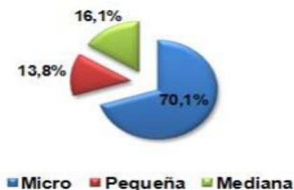
Ilustración 1: Distribución Microempresas