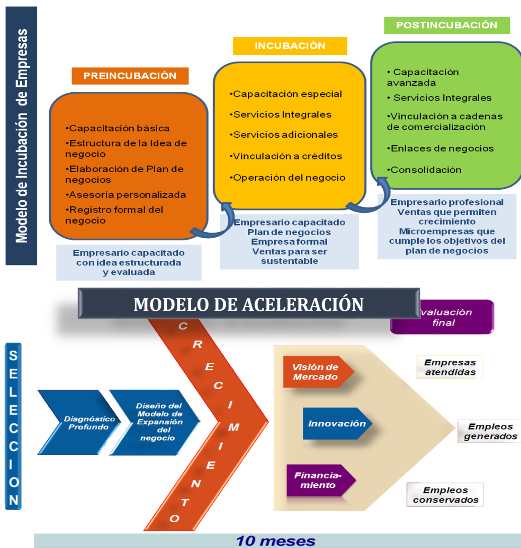
Ilustración 2. Modelo de Incubación de Empresas