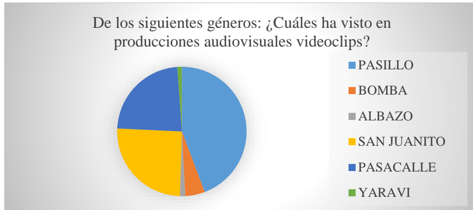
Figura 5.

Sobre la observación de videoclips de géneros musicales nacional, el pasillo ocupa el 44%, el san Juanito el 25%, el pasacalle el 23%, la bomba el 5%, el albazo el 2% y el yaraví el 1%.