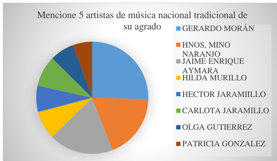
Figura 7.