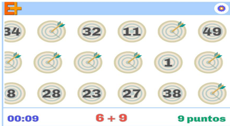
Figura 1. Dianas móviles-suma

Posteriormente, cada estudiante realizó la actividad del juego Dianas móviles – Suma, que consistió en seleccionar uno de los sumandos con los que se quería practicar, en este caso se seleccionó el sumando +9. El juego consistió en realizar 10 operaciones en un minuto, el simulador le otorgó un puntaje según los aciertos y el tiempo empleado para realizar el juego, si el estudiante realizó en un tiempo menor al minuto las operaciones, podía continuar con otro juego acumulando puntos. Como se aprecia en la Figura 1. Y al final el juego dio el resultado de cada intento de cada estudiante.