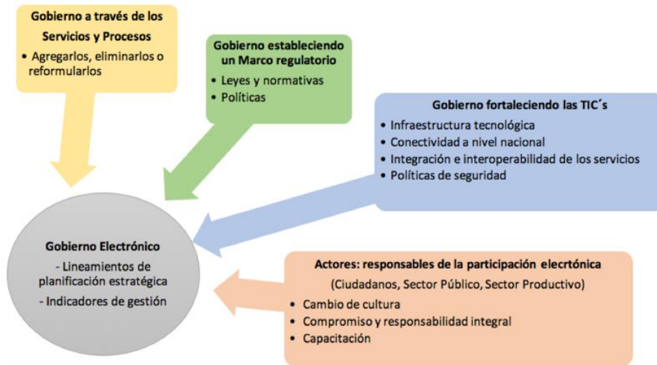
Figura 2. Componentes generales del Gobierno Electrónico