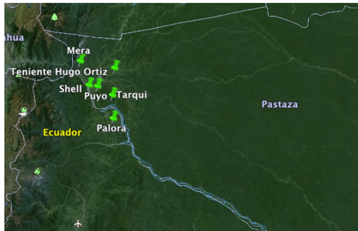
Figura 2. Parroquias de las Provincias de Pastaza y Morona Santiago abordadas en el presente estudio.

En la Tabla 1 se observa el número de predios evaluados y su pertenencia a las tres provincias y a la iniciativa Socio Bosque.