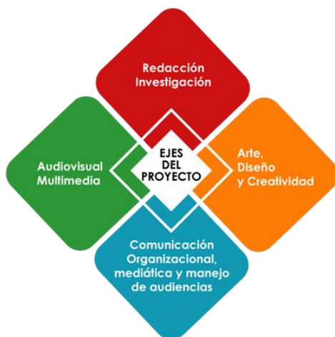
Gráfica 1.- Ejes integrados en el PIS de la UIDE