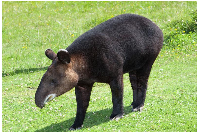
Figura 1. Individuo adulto del tapir de montaña ( Tapirus pinchaque Roulin)

Entre ellas, se propuso la realización del presente proyecto con la finalidad de establecer un sistema de monitoreo e investigación del tapir de montaña ( Tapirus pinchaque ; Figura 1). La observación de esta especie en su hábitat natural está empezando a ser realizada por empresas de orientación ecoturística.