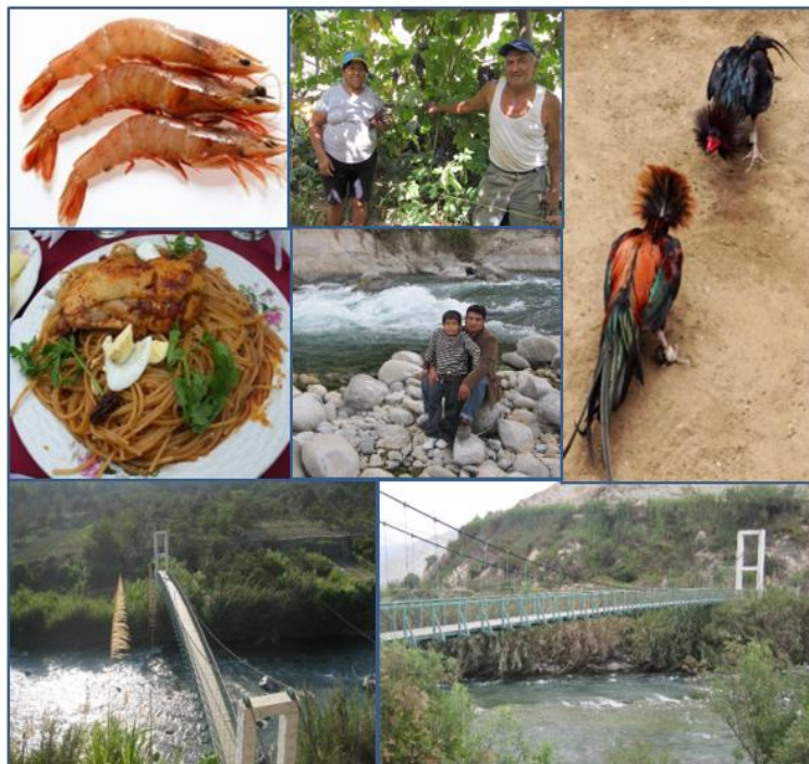
Ilustración 1. Tradiciones, costumbres y potencialidades del distrito de Lunahuaná.

Las personas autóctonas de la zona, así como empresarios proactivos ciudadanos, que han tenido capital para invertir y la visión de un futuro próspero para Lunahuaná como centro turístico, han logrado incrementar en poco tiempo sus ingresos desde la década del 90. En la actualidad, los pobladores aún se dedican a la agricultura, pero ante la explosión turística aparecen otras oportunidades de trabajo a los habitantes que se asentaron en la localidad, fundándose empresas relacionadas al turismo como: restaurantes, hoteles, bodegas vitivinícolas, agencias de turismo; acompañados del comercio ambulatorio que ofrecen productos de la zona en sus diversas variedades. Estas acciones se presentaron en el distrito dado la gran afluencia los fines de semana de turistas de diversos sitios, principalmente de la capital, quienes consideran a Lunahuaná como un lugar cercano, divertido, aventurero y una gran posibilidad para “escapar” de la congestionada capital limeña (Fuller, 2010; Sotelo, 2018).