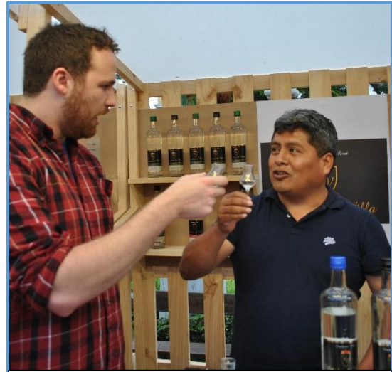
Ilustración 2. Degustación del pisco. Interacción del lugareño con el turista

El turismo gastronómico , que forma parte de nuestra entidad nacional desarrollando técnicas culinarias para la preparación de los alimentos en sus diversas variedades, siendo una tradición turística por la variedad de platos típicos de cada lugar a nivel nacional, en especial en el distrito de Lunahuaná, lugar donde no sólo destacan sus exquisitos potajes, sino el muy valorado pisco peruano cuyo origen de producción ha generado un debate mundial. En el Perú existe una provincia del departamento de Ica, (Al sur de Lima) llamada Pisco, y además se tiene conocimiento que se cosecha la uva en sus diversas variedades y se fabrica este licor en cinco departamentos del litoral peruano: Lima (principalmente su provincia Cañete-Lunahuaná), Ica, Arequipa, Moquegua y Tacna. Es recomendable ante lo mencionado, elaborar una ruta turística del pisco, para conocer los principales viñedos y bodegas donde se elabora el tradicional pisco. En la Provincia de Cañete resaltan las principales bodegas como Viñedos de Villa (bodega artesanal turística donde se exponen vinos y piscos), Zapata, de los Campos, Santa María, El Rosedal, Antigua Bodega Rivadeneyra, y el Fundador de Cañete. Se recomienda realizar la degustación en el verano porque ahí los visitantes podrán ser partícipe de la vendimia y observar el proceso de la destilación y fermentación del producto (Portocarrero & Ugarte, 2013; Gestión, 2017).